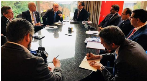
ProInversión participará de Roadshow en la ciudad de Vancouver.

ProInversión promoverá activamente en Vancouver (Canadá) oportunidades de inversión en Perú, en el marco de un Roadshow que se realizará este 20 y 21 de setiembre.