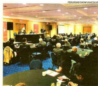
El Perú Road Show Vancouver reunió a empresarios de varios sectores.

Entre las oportunidades de inversión destacan proyectos en infraestructura (carreteras, puertos y vías férreas). Asimismo, figuran los proyectos mineros de Colca y Jalaoaca, en Apurímac, que, aún estando en sus etapas iniciales, parecen tener un importante potencial de producción de cobre, con presencia de oro en el segundo caso y de molibdeno en ambos. —