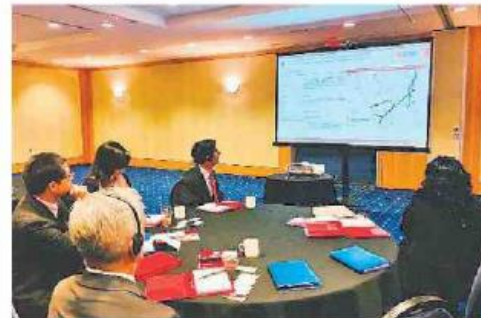
Cartera. Perú presentó iniciativas a empresarios canadienses.

También se presentaron los proyectos de la Autopista Internacional del Norte: Sullana-Puente Internacional La Paz, estimado en 691 millones de dólares; la Vía Alternativa a la carretera Central (Canta-Huallay-Unish), cuya inversión es de 561 millones 600,000 soles, y el Anillo Vial Periférico, calculado en 2,049 millones.