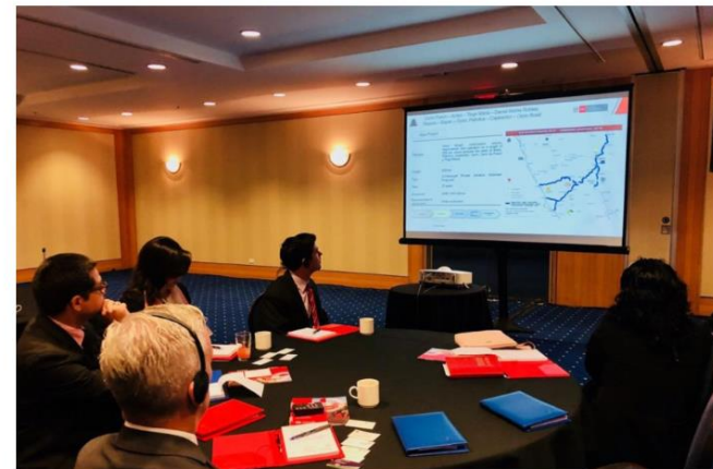
Road Show en Canadá.

En el Perú Road Show Vancouver 2018 lanzó portafolio de inversiones por más de US$10 mil millones