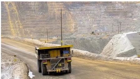
El MEM anunció que buscan hacer viable no menos de US$21,00 millones de inversión en proyectos mineros para el 2021.