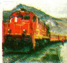
Cartera por USD 11 mil mlns.

Una cartera de 50 proyectos para el periodo 2018-2020, con una inversión estimada en más de USD 11 mil millones, presentó ProInversión en Vancouver (Canadá), en el marco de un Roadshow que culminó