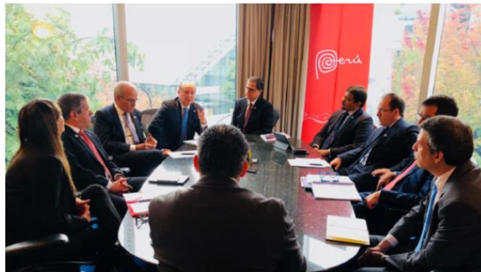
El ministro de Energía y Minas adelantó los planes de mineras canadienses.