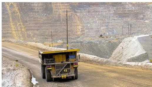
El MEM anunció que buscan hacer viable no menos de US$21.00 millones de inversión en proyectos mineros para el 2021.

En un 'road show' en la ciudad de Vancouver, una delegación de funcionarios peruanos dio a conocer 50 proyectos de inversión que se adjudicarán hasta el 2020 en áreas como infraestructura, minería, salud, entre otros.