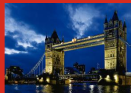
inPERU LONDRES 4 - 5 de septiembre