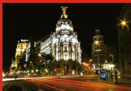
inPERU MADRID 1 - 2 de septiembre