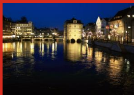
inPERU ZÜRICH 3 de septiembre