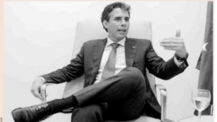
El ministro de Producción de Perú, Piero Ghezzi, durante su reciente encuentro con EXPANSIÓN en Madrid.

“Existen hoy una oportunidad en el sector de las infraestructuras. Por ejemplo, todavía hay muchas carreteras que están en condiciones mínimas [materiales]”, explica Ghezzi a EXPANSIÓN poco