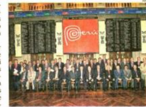
COLECTIVO DE PESO. La delegación peruana está formada por 55 empresarios y autoridades.

pasajero que se debe principalmente, aunque no exclusivamente, a factores externos, pues el "exceso de tramitología también ha inhibido las inversiones". Sin dejar de reconocer los grandes problemas que enfrenta el país, Ghezzi instó a los inversionistas españoles—empresas medianas, en buena parte—a aprovechar las grandes oportunidades que ofrece el Perú en sectores como forestal, acuicultura, agroindustria, entre otros.